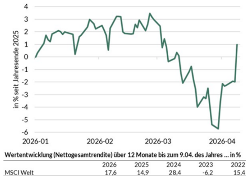
Abb. 2: Entwicklung des MSCI Welt-Index seit Jahresbeginn

Der Krieg im Nahen Osten hat zwar nicht alle Regionen der Welt gleichermaßen getroffen, aber doch die Weltwirtschaft insgesamt in Mitleidenschaft gezogen. Deshalb dürfte es auch international agierenden Unternehmen schwerfallen, eine Wachstumsschwäche in einer Region durch Geschäftszuwächse in anderen auszugleichen. Von daher stellen wir uns für die kommenden Monate auf Enttäuschungen bei den Unternehmensgewinnen ein. Allerdings kann der Markt nach unserer Einschätzung eine solche Ergebnisschwäche verkraften, wenn sie als vorübergehend angesehen werden kann. Die aktuelle Marktreaktion auf den Waffenstillstand jedenfalls war positiv (s. Abb. 2).